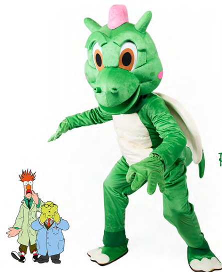
Paf - El drac

Contacte i contractació Ismael Berengena 620578698 ismaelberengena@gmail.com http://rockperxics.com/