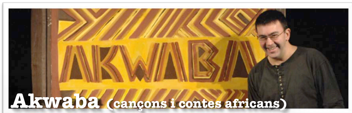
Akwaba (cançons i contes africans)

Enllaç web: http://www.rah-mon.com/ca/espectacles/teatre-infantil/la-vella-radio