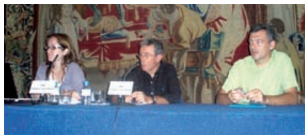
— Jornada ACM-MUSICAT a la Fontana d'Or de Girona.

cooperatives de músics i els avantatges que suposa contractar les actuacions a través de MusiCat. Les jornades van tenir lloc a Barcelona, Girona, Tarragona, Lleida i Tortosa. En total, van assistir a les xerrades representants de 111 ajuntaments i consells comarcals.