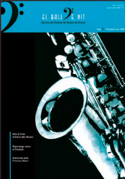
Portada del primer número de la revista "El Ball de Nit"

No es pas la meua intenció, precisament ara que estic jubilat, tornar-me a dedicar a fer balls de nit.